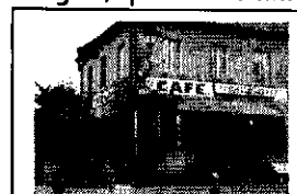
Ancien Café Parel à Clergoux

Commence alors leur participation à la Résistance : Ils participent à plusieurs opérations : bataille d'Egletons, prise de Tulle... Yvan, chirurgien, soigne les blessés.