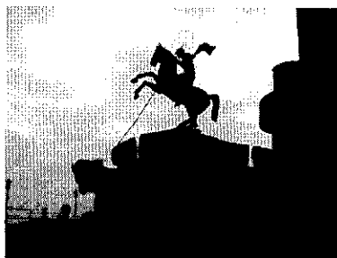
St-Georges terrassant le dragon